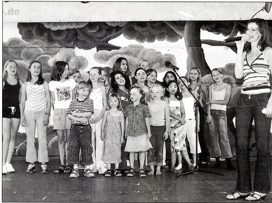
Sieger, Sponsoren und Jury-Mitglieder des Castings »Du bist der Star« freuten sich über die CD mit dem Druck des Liedes. 80 Kinder waren letztlich an der Aufnahme beteiligt.

(HK). Unbekannte en Sonntag, 13. Juli, g 20. Juli, in die wohnung eines ahauses an der Straße eingebrochen. ein Holzfenster auf- ahlen zwei Kameras,