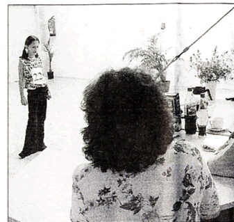
Vor der Jury ist die Nervosität am größten: Auftritt wochenlang geprobt.

Unklar ist, wie viel Show im Wettbewerb selbst steckt: Der hallenartige „Casting“-Raum und der Lärm davor versprühten jedenfalls nicht die Professionalität der „großen“ Star-Wettbewerbe. Vielleicht war es besser, denn die Kinder, die mit ihrer „Performance“ nicht zufrieden waren, konnten sich wieder in den Alltag stürzen: große Spielgeräte scheinen ihnen jedenfalls noch genauso gut zu gefallen wie die Aussicht auf die Showkarriere. Johannes Wagemann