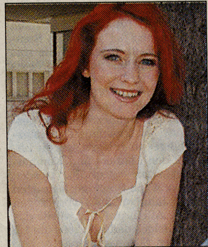
Der oder die Siegerin wird mit Claudia Uhle im Duett singen.

Doch auch alle anderen Teilnehmer werden auf der CD verewigt, sie singen im Background-Chor. Den vier hochkarätigen Jurys gehören die drei Musiker von »Xperience« sowie Vertreter von Plattenfirmen und Studios an. Lokalteil